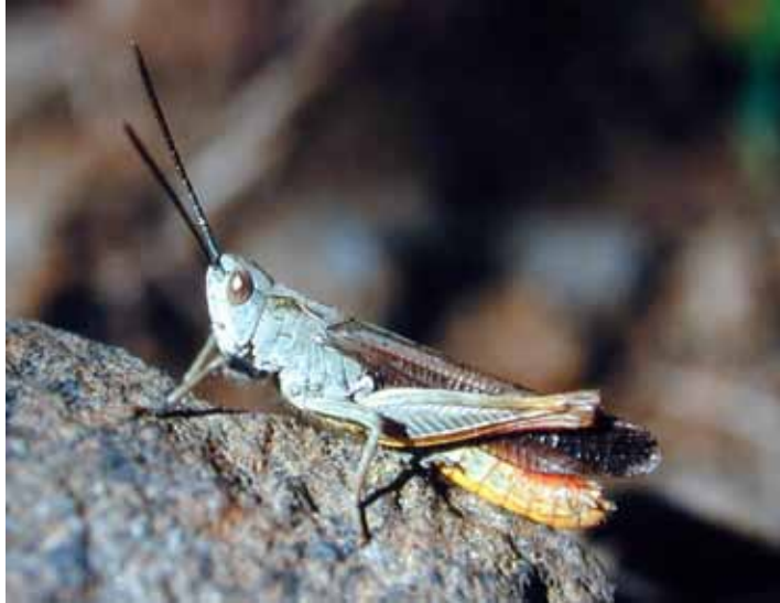
Nachtigallgrashüpfer haben an den Hinterbeinen eine sogenannte Stridulationsleiste, mit der sie in einem bestimmten Rhythmus die Flügel entlang streichen und so mit einem kratzenden, atonalen Geräusch auf sich aufmerksam machen.